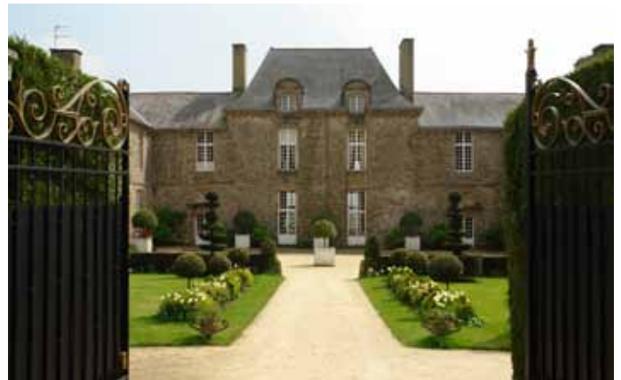
Jardins du Château de La Ballue Cour d'honneur du Château de La Ballue