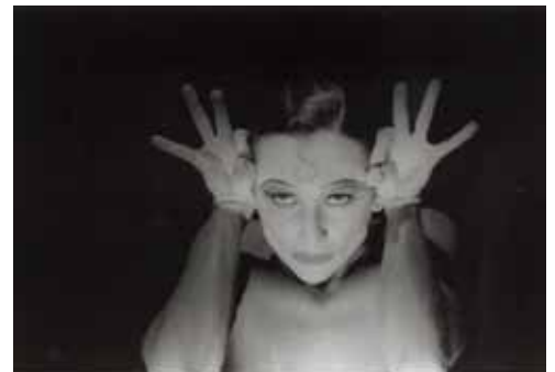
Une mystérieuse chose a dit e.e. Cummings* , Vera Mantero, 1996